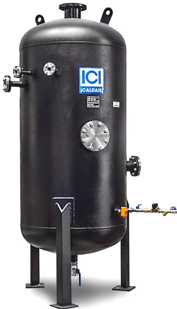
Рисунок носит указательный характер